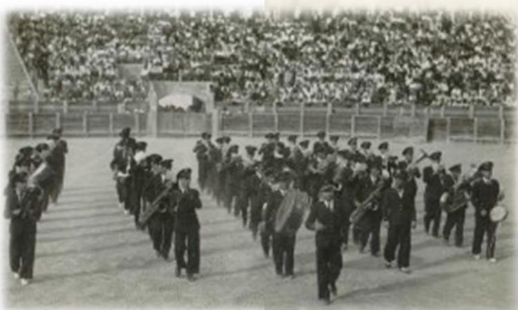
5 septiembre 1944. La Banda Municipal de Villena en la Plaza de Toros.