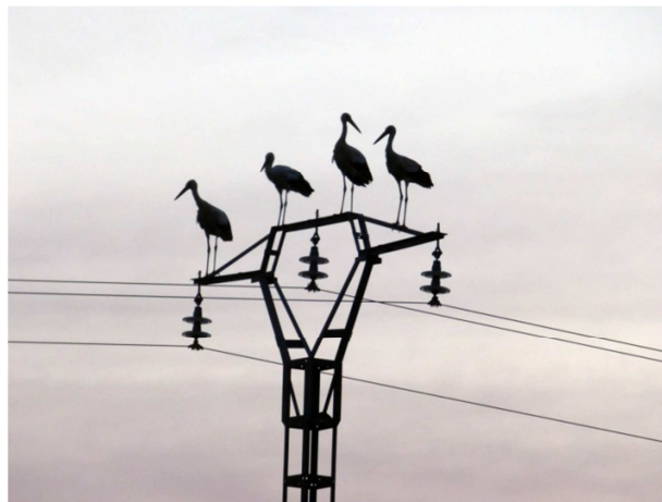
• cigüeñas blancas Villena Roser Sánchez Alemany

Creación de un "Consejo de Mayores" donde estuvieran representadas las organizaciones locales de mayores y l@s ciudadanos jubilados en general para proponer políticas relacionadas con el sector".