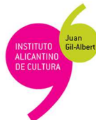
INSTITUTO ALICANTINO DE CULTURA Juan Gil-Albert